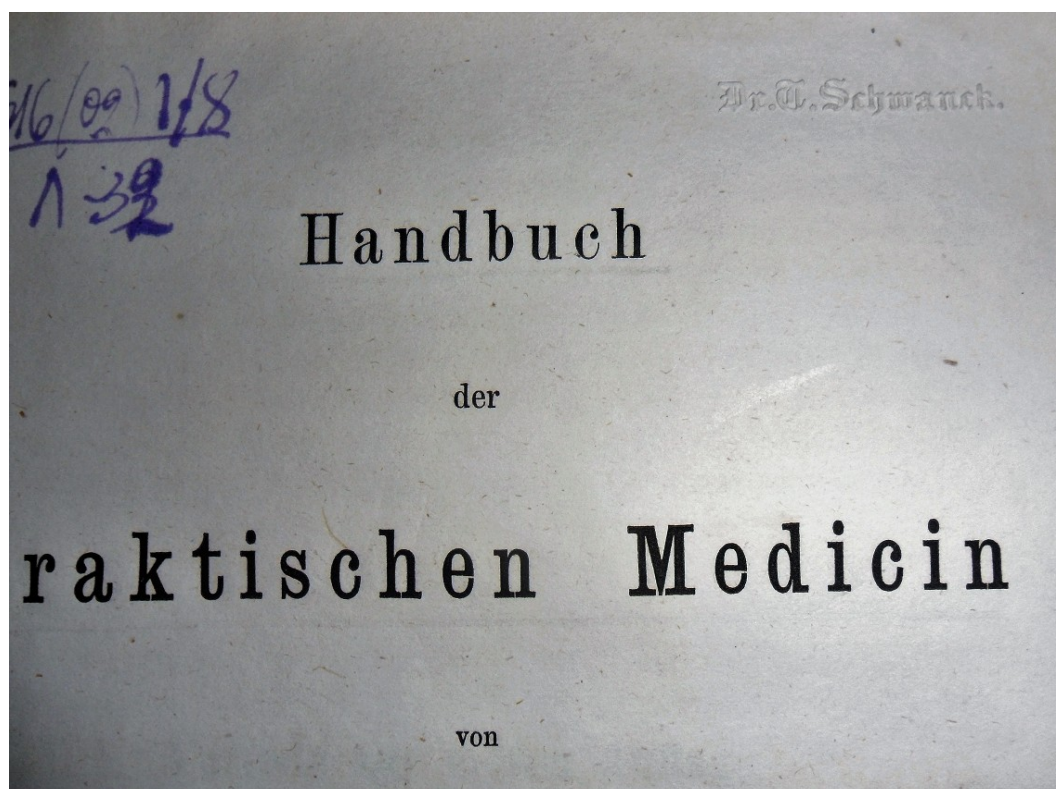
Фрагмент обложки книги с оттиском печати Ф.Ф. Шванка (Руководство по практической медицине, 1860)