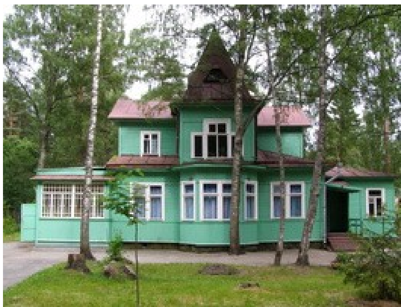
Дача Ф.Ф. Шванка в Ушково (современный вид)

Помощник Главного Доктора Гольбек [18.7]