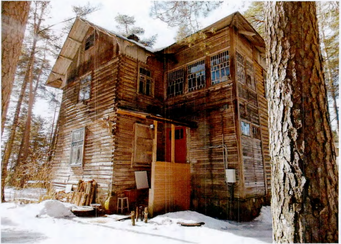
4. Восточный фасад