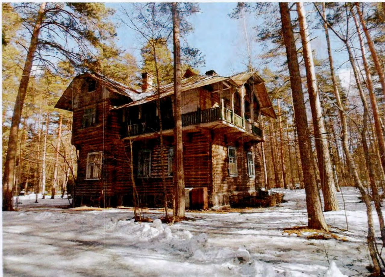
1. Вид со стороны южного и западного фасадов

Фотографическое изображение объекта культурного наследия регионального значения «Дача Е. Ф. Корзухиной», расположенного по адресу: Санкт-Петербург, посёлок Ушково, Пляжевая улица, дом 14а, литера А (согласно распоряжению КГИОП от 27.10.2016 № 10-574: Санкт-Петербург, посёлок Ушково, Пляжевая улица, дом 14а, литера А)