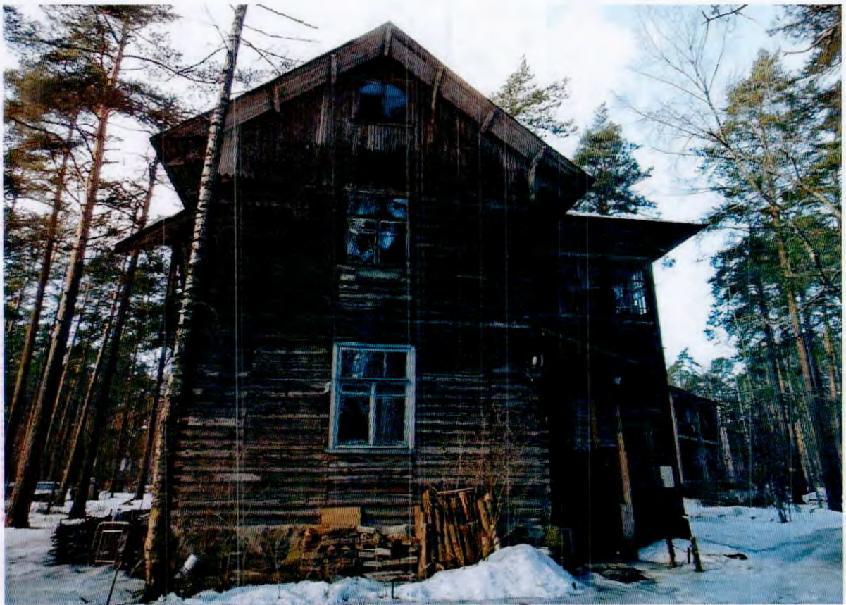
5. Восточный фасад