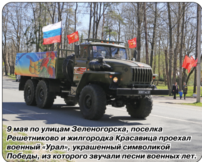
9 мая по улицам Зеленогорска, поселка Решетниково и жилгородка Красавица проехал военный «Урал», украшенный символикой Победы, из которого звучали песни военных лет.