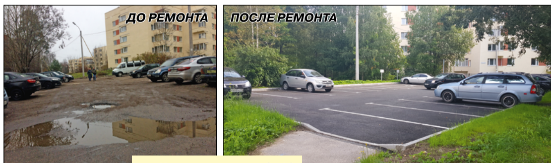
ул. Комсомольская, 6, 10

– Выражаем благодарность нашим зеленогорским озеленителям, самым лучшим озеленителям Санкт-Петербурга, и надеюсь, что в 2020 году они нас порадуют еще большими выдумками в озеленении города Зеленогорска, – сказал в своем выступлении И.А.Долгих