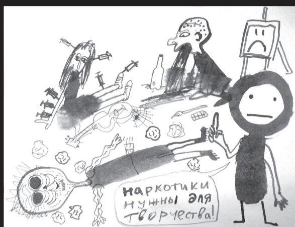
Рисунки художника Бориса Лавренко