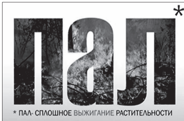
* ПАЛ- СПЛОШНОЕ ВЫЖИГАНИЕ РАСТИТЕЛЬНОСТИ

2. Вред, наносимый травяными палами здоровью и жизни человека