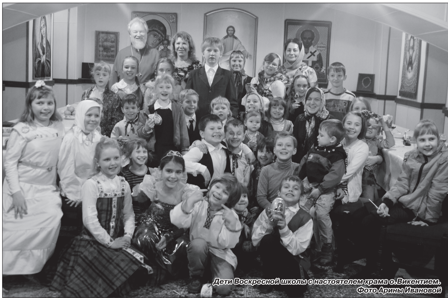
Дети Воскресной школы с настоятелем храма о.Викентием.

Н.В.Беловодова, преподаватель Воскресной школы Храма Казанской иконы Божией Матери Зеленогорска