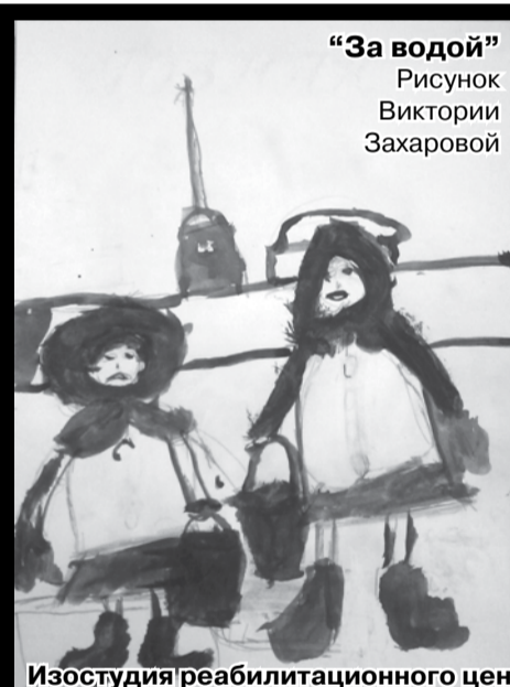
"За водой" Рисунок Виктории Захаровой

СТРАНИЦА ПОДРОСТКОВО-МОЛОДЕЖНОГО ЦЕНТРА "СНАЙПЕР"