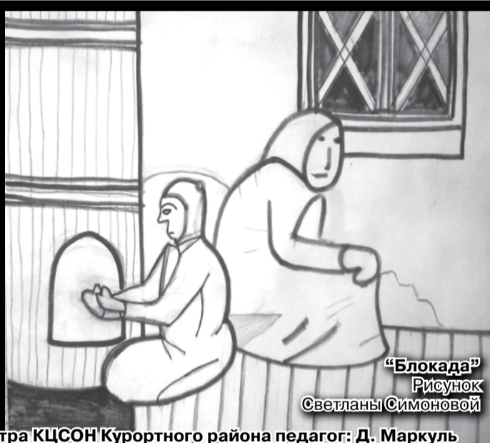
"Блокада" Рисунок Светланы Симоновой

Изо студия реабилитационного центра КЦСОН Курортного района педагог: Д. Маркуль