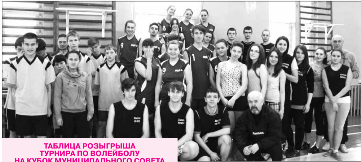
ТАБЛИЦА РОЗЫГРЫША ТУРНИРА ПО ВОЛЕЙБОЛУ НА КУБОК МУНИЦИПАЛЬНОГО СОВЕТА ГОРОДА ЗЕЛЕНОГОРСКА

Такая система проведения соревнований, на наш взгляд, позволит поддерживать мотивацию к занятиям спортом у школьников на достаточно высоком уровне.