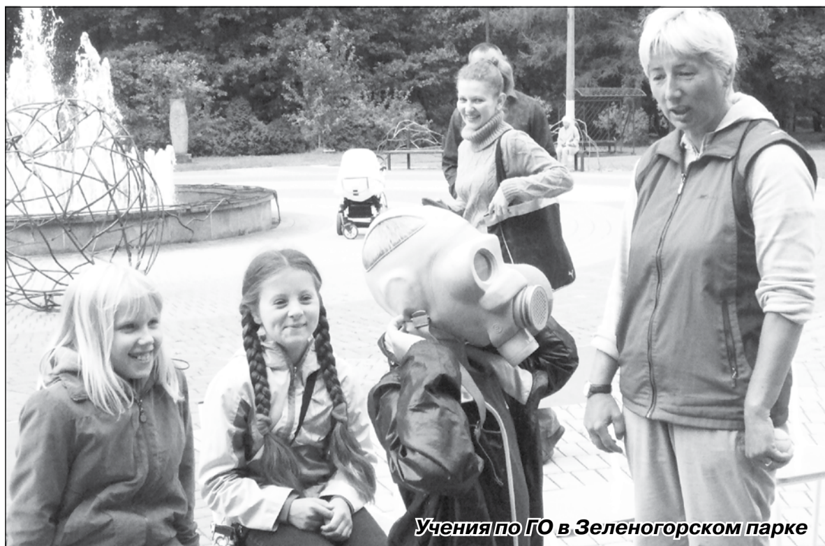
Учения по ГО в Зеленогорском парке

Территориальный отдел по Курортному району УГЗ ГУ МЧС России по Санкт-Петербургу