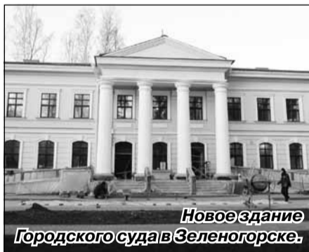
Новое здание Городского суда в Зеленогорске.