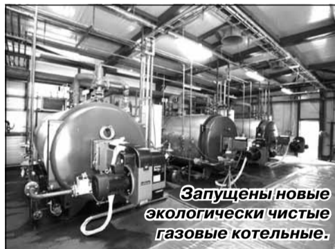
Запущены новые экологически чистые газовые котельные.