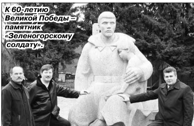
К 60-летию Великой Победы – памятник «Зеленогорскому солдату».