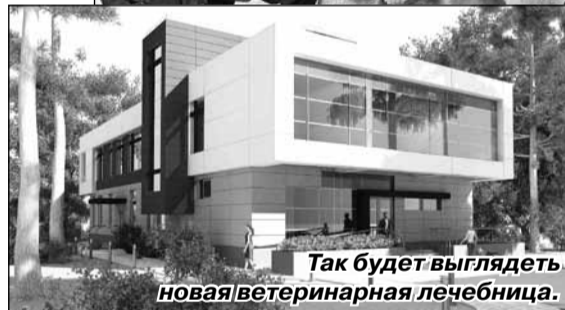
Так будет выглядеть новая ветеринарная лечебница.