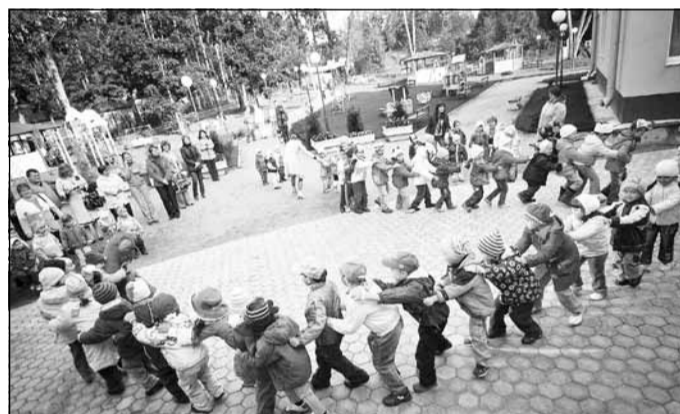
Детский сад №19.