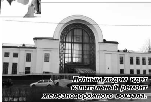
Полным ходом идет капитальный ремонт железнодорожного вокзала.