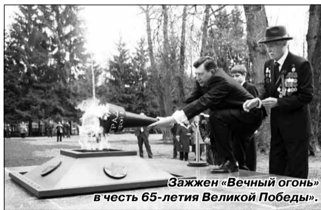
Зажжен «Вечный огонь» в честь 65-летия Великой Победы.