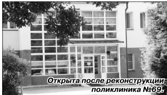
Открыта после реконструкции поликлиника №69.