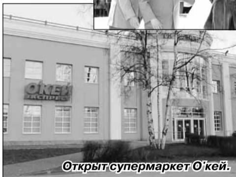
Открыт супермаркет О'кей.