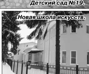
Новая школа искусств.